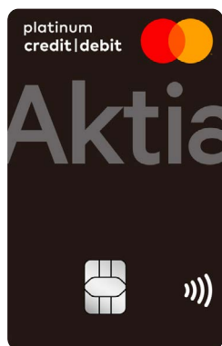
Aktia Platinum Credit/Debit